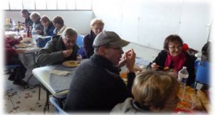
Bienvenue aux nouveaux adhérents

Vous avez aussi participé en nombre à l'assemblée générale le 2 février. Cela montre la convivialité qui existe au sein de notre association. Le conseil d'administration s'est ensuite réuni pour élire le bureau.